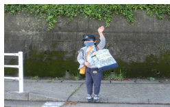
(再開後1番に登校したK君です。)

学校では、集団感染のリスク対応として、3つの密（密閉空間、人の密集、近距離での会話）を同時に重なる場を避けるための対策を全職員で確認しました。